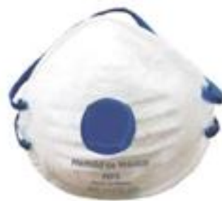
1630 Con sello contorno y válvula de exhalación