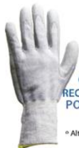
GUANTE CON RECUBRIMIENTO DE POLIURETANO GTNPU ◦ Flexible ◦ Alta maniobrabilidad