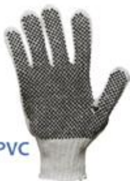
JAPONES con PVC GTJAP-PVC ◦ Mejor agarre