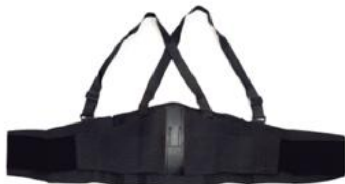
FAJA REFORZADA 9.5" FETH