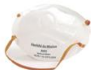
1710 Puente nasal sencillo