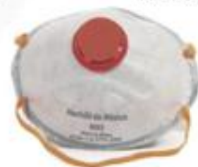
1750 Con carbón activado, sello contorno completo y válvula de exhalación