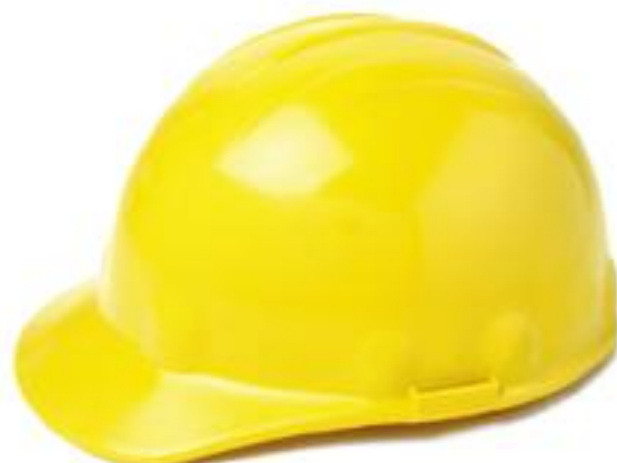
CASCO TIPO CACHUCHA CASCO