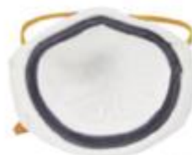
1720 Espuma contorno completo para mejor sellado