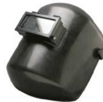
CARETA VENTANA LEVANTABLE CARETA-FVVL