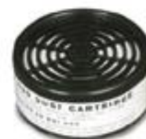
R-620 Polvos no tóxicos