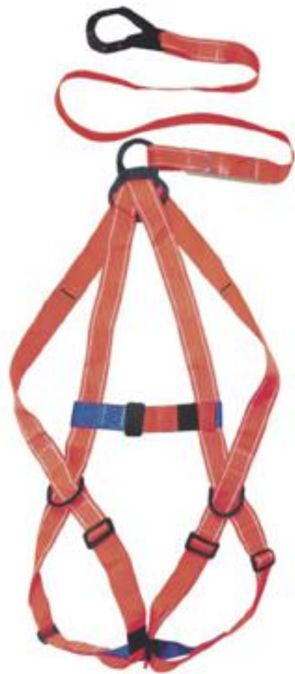
A3A-D ARNÉS DIELECTRICO 3 ARGOLLAS