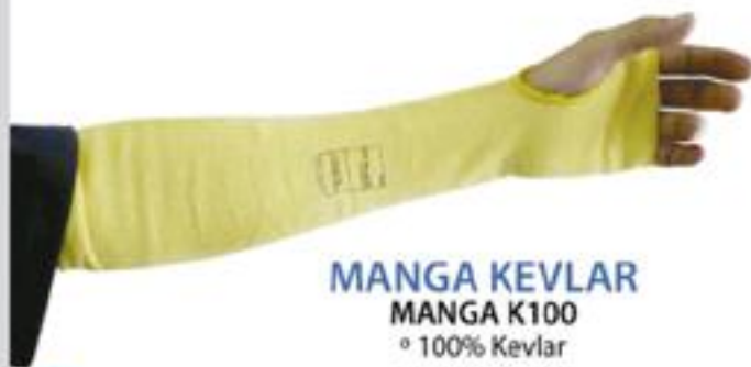
MANGA KEVLAR MANGA K100 ◦ 100% Kevlar