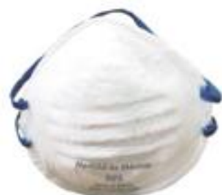
1610 Puente nasal sencillo 1620 Espuma contorno completo para mejor sellado