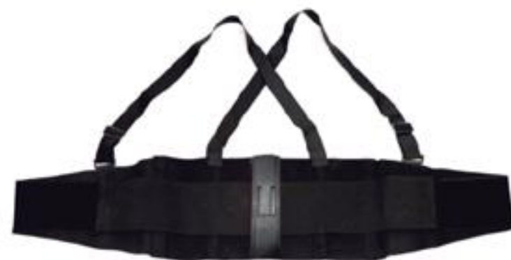
FAJA REFORZADA 8" FET84