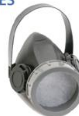
RHH1T Respirador de un cartucho