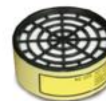
RC-205 Gases ácidos