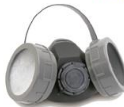
RHH2T Respirador de dos cartuchos