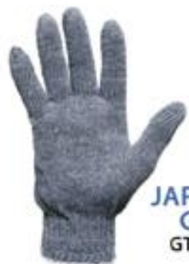
JAPONES GRIS GTJAP-G