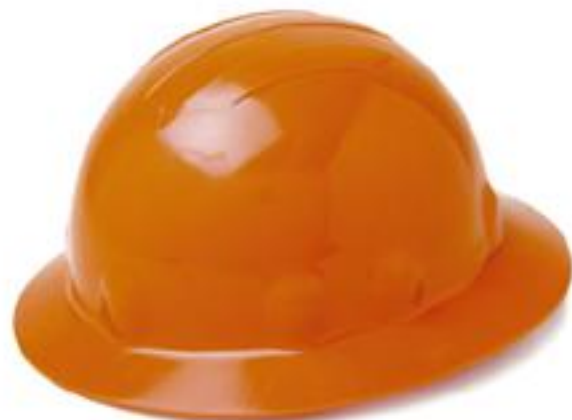
CASCO TIPO MINERO CASCO E