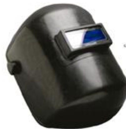
CARETA-FV ◦ Termoplástica con 30% fibra de vidrio ◦ Suspensión de matraca