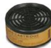
R-621 Vapores orgánicos