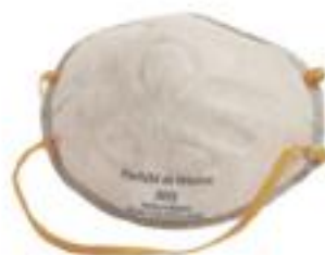
1740 Con carbón activado y sello contorno completo