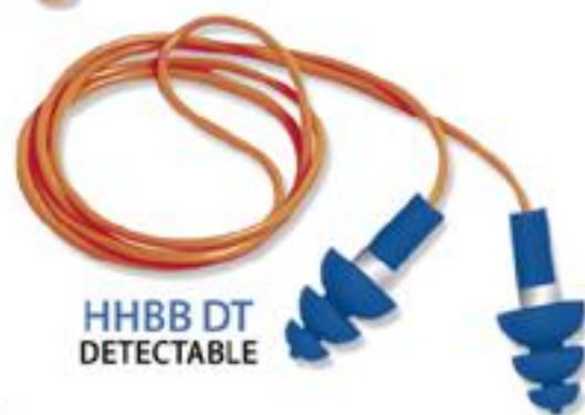
HHBB DT DETECTABLE