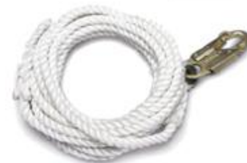
CUERDA LP2-5 / LP2-10 / LP2-20 ° Diferentes longitudes