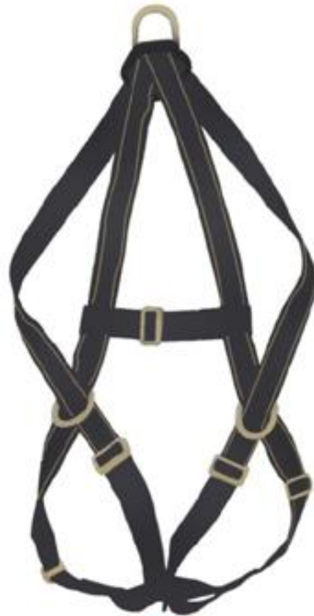
A3A-K ARNÉS CON KEVLAR 3 ARGOLLAS