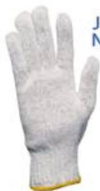
JAPONES NATURAL GTJAP-B