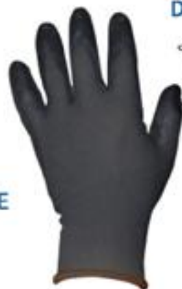
GUANTE CON RECUBRIMIENTO DE NITRILO GTNN ◦ Buen agarre, abrasión y pinchaduras