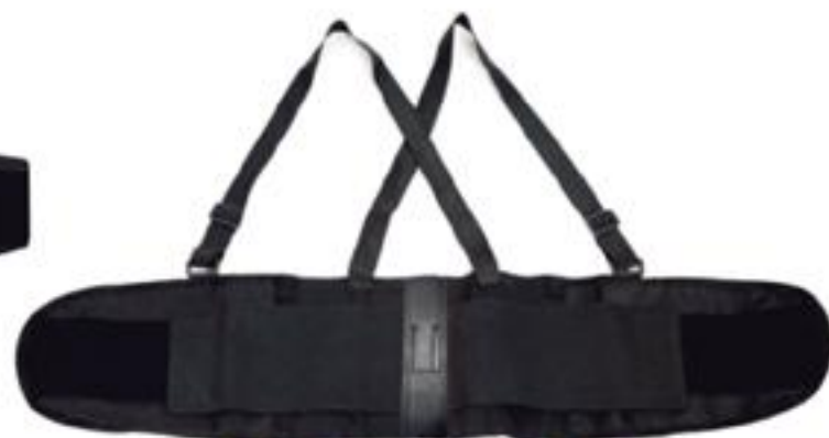
FAJA REFORZADA 8" FET85