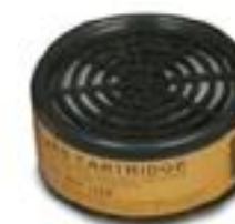
R-622 Vapores orgánicos y pinturas