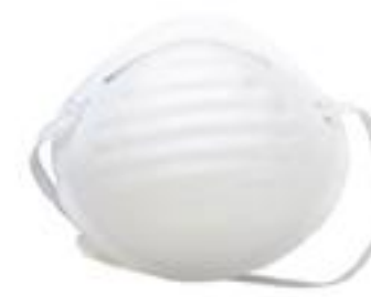
1501 ◦ Mascarilla sencilla 1 liga. ◦ Con puente nasal.