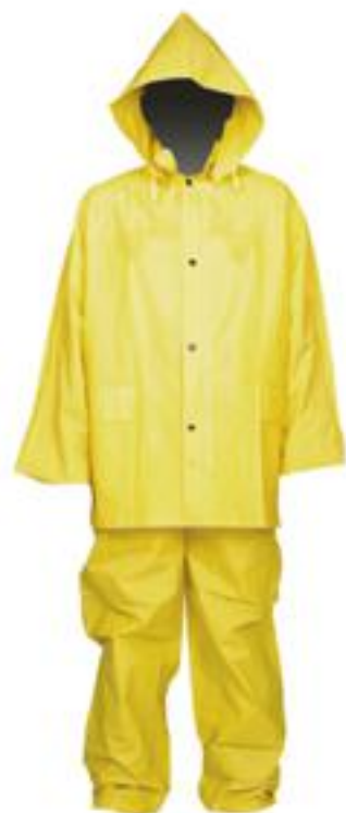
IMPER 3 Tres piezas