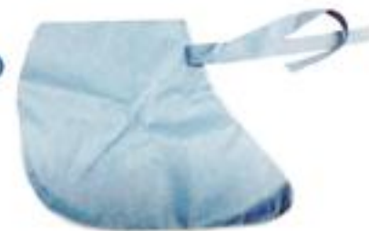
BOTA CIRUJANO CUBREZAPATO-L