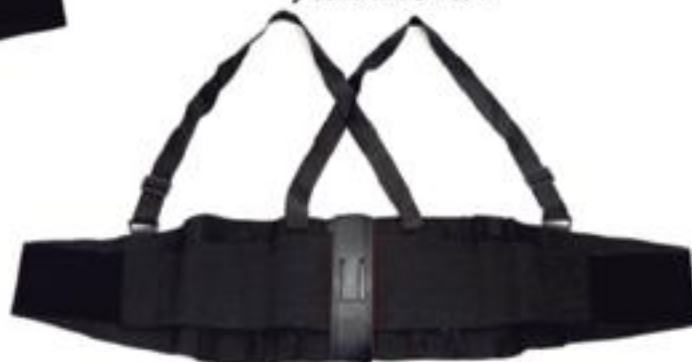
FAJA REFORZADA 8" FET84R