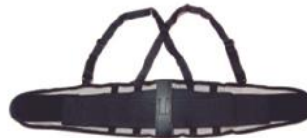
FAJA VENTILADA 8" FETV4R