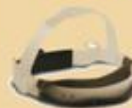
S-3 ◦ Con ajuste de matraca