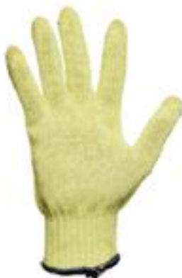
KEVLAR GTKPM ◦ Peso medio