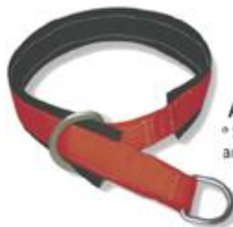
ANCLA2 ° Soporte y anillo de 3"