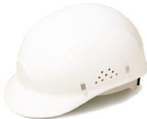
CACHUCHA HIGIÉNICA BCAP