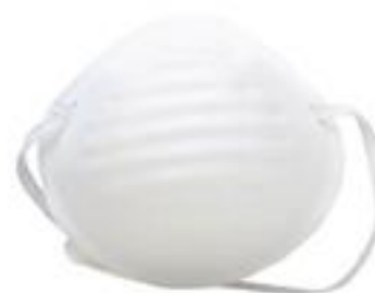
1500 ◦ Mascarilla sencilla 1 liga. ◦ Sin puente nasal