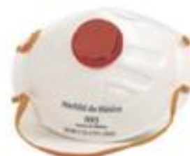
1730 Con sello contorno y válvula de exhalación