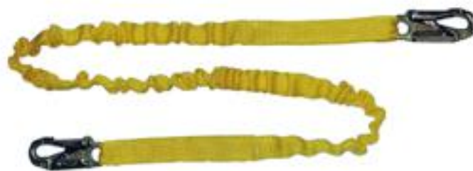
LV-POY LÍNEA DE VIDA TUBULAR