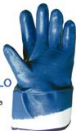
LONETA NITRILO GTN-LONETA ◦ Alta resistencia a la abrasión, grasas y aceites