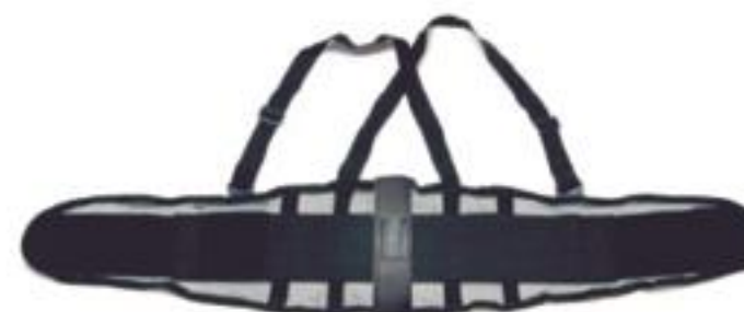
FAJA VENTILADA 8" FETV4